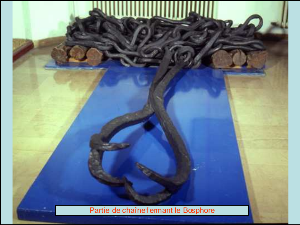
Partie de chaîne fermant le Bosphore